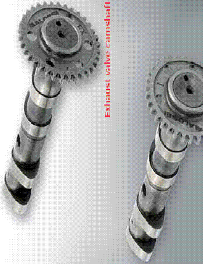
Exhaust valve camshaft