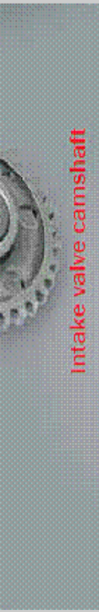
Intake valve camshaft